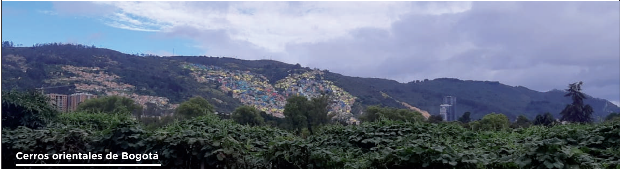
Cerros orientales de Bogotá

De acuerdo a la Encuesta Multipropósito de Bogotá 2014, en la capital hay 115.088 personas afro, de esa cifra 64% migrantes de toda la vida y un 36% de migrantes de hace menos de cinco años. Adicionalmente, el 37% de la población de los afrodescendientes viven en casas, el 60.2 % lo hacen en apartamentos y el 2.8% en cuartos o habitaciones.