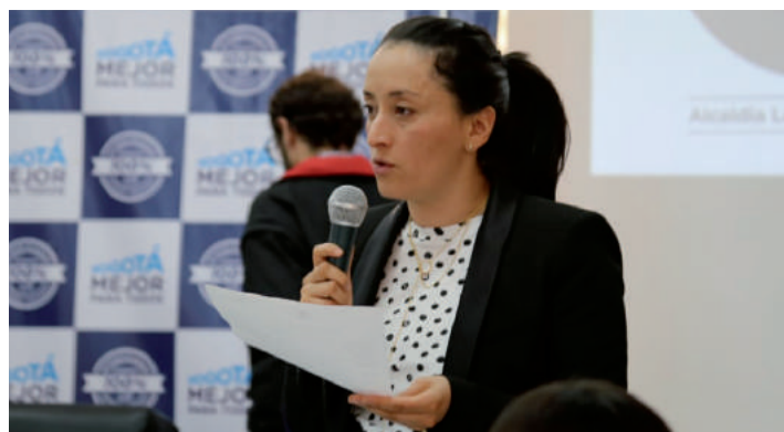
Mayda Cecilia Velásquez Alcaldesa Local de Usaquén

Invito a la comunidad a trabajar mancomunadamente para mejorar la calidad de vida de todos los habitantes buscando la paz y la buena convivencia a través de conductas adecuadas, plasmadas ya, dentro del Código Nacional de Policía.